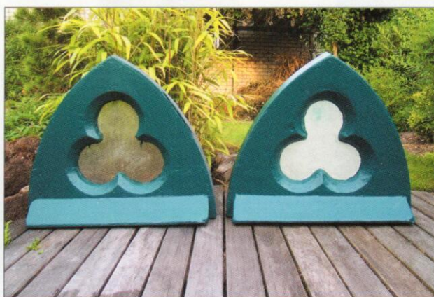
Afb 1. Boven in deze kerk is een antenne-installatie aangebracht en geheel aan het oog onttrokken. Het linker raam in het bovenste galmgat is origineel, het rechter exemplaar (met de antenne) werd gekopieerd.