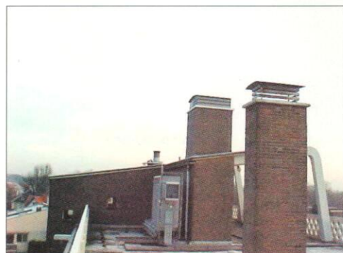
Afb. 2 Eerst stond er een antennemast naast de schoorsteen. Er werd een tweede (loze) schoorsteen geplaatst en de antenne is onzichtbaar.

antennes in de bebouwde omgeving'. Om die antennes niet op te laten vallen worden verschillende technieken gebruikt. Hierbij wordt ervoor gezorgd dat precies dezelfde materialen worden nageemaakt die ook al zijn toegepast in die specifieke omgeving waar de antenne is gepland, zoals leisteen, glas, hout en bijvoorbeeld muren. Ook worden antennes voor het oog onzichtbaar 'verwerkt' in dakkapellen, reclameborden, kerktorens en kerkornamenten, kabelgoten, raamkozijnen, schoorstenen, aircopijpen, gevelornamenten etc.